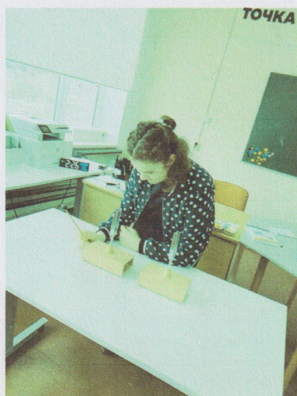
Внеклассное занятие по теме: «Звук»