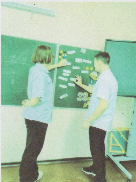
Внеклассное мероприятие «Знатоки физики»