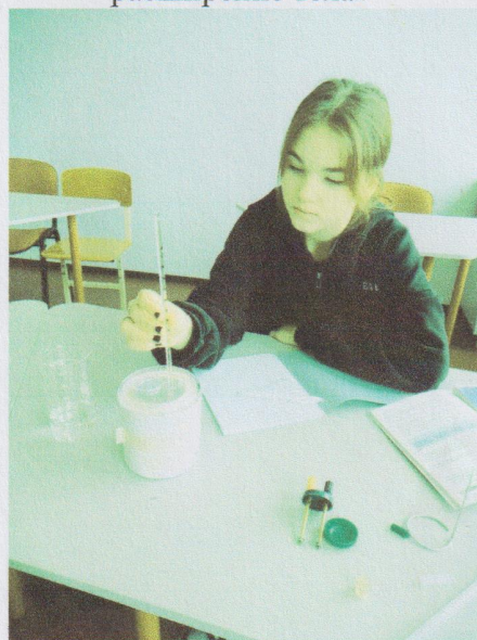
Лабораторная работа по теме «Расчет количества теплоты»