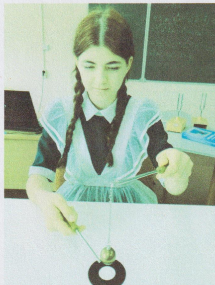
Урок по теме: «Тепловое расширение тела»