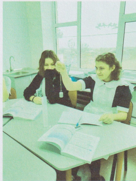
Лабораторная работа по теме «Плавание тел»