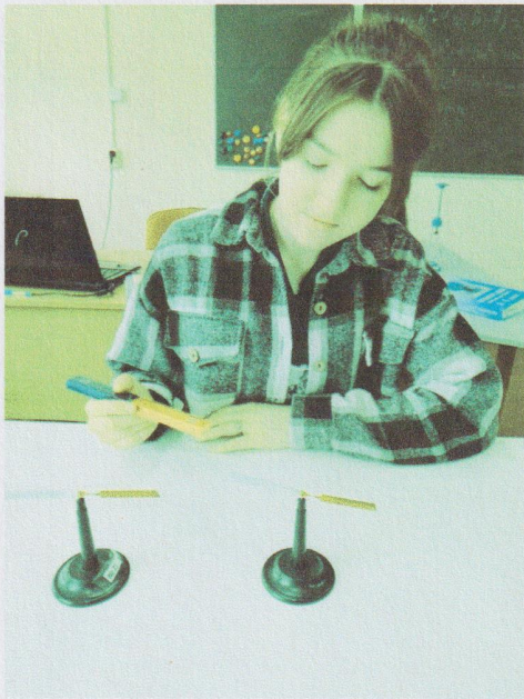
Урок по теме: «Магниты»