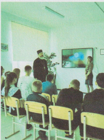
Встреча с Отцом Александром по теме «Нравственность и ЗОЖ»