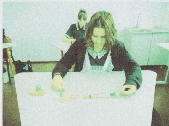
Урок по теме: «Трение»